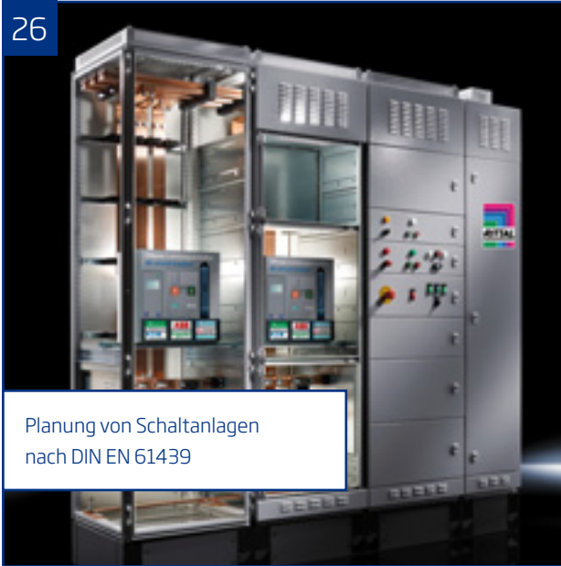
Planung von Schaltanlagen nach DIN EN 61439