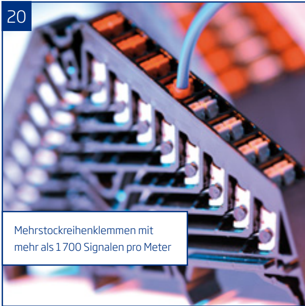
Mehrstockreihenklempen mit mehr als 1700 Signalen pro Meter