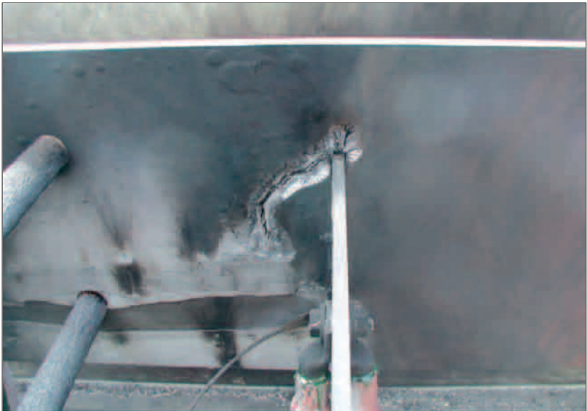
Bild 1.3 Teilentladungskanal in einer Isolierstoffplatte mit anschließendem Kurzschluss

An einem 30-kV-Freilufttransformator war zum Anschluss der vier Kabel je Leiter ein Hilfsschienensystem mit Cu-Schienen und Isolierstoffplatten aus Schichtpressstoff in einem abgedichteten Gehäuse montiert worden. Be- und Entlüftungsöffnungen waren nicht vorhanden. Der Transformator war – außer bei der Inbetriebnahme – noch nicht in Betrieb gewesen, auch über den Winter hinweg nicht. Die zwangsläufig auftretende Befeuchtung durch Kondenswasser bei Taupunktunterschreitungen führte zur Schwächung der Isolationsfähigkeit der Isolierstoffplatten. Schon nach kurzer Betriebszeit von wenigen Stunden erfolgte – ausgehend von den Ecken der Cu-Schienen – die Zerstörung der Isolierung durch Teilentladungen mit anschließendem Durchschlag und Kurzschluss. Bei Verwendung von Freiluftstützern für das Hilfsschienensystem hätte das verhindert werden können. Der Teilentladungskanal ist in Bild 1.3 gut zu erkennen.