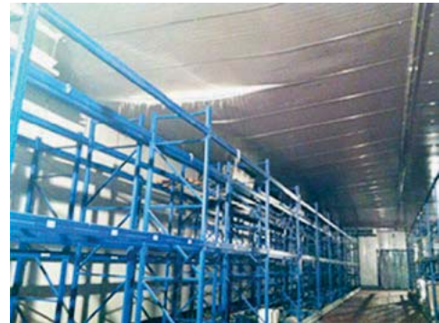
Abbildung 4 Durch Frost gerissener Boden und eingesunkenes Dach